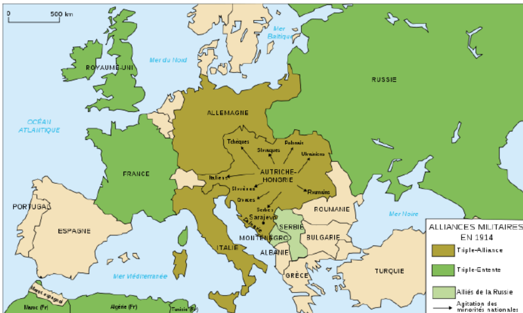
Doc B : les alliances en Europe en 1914

Chaque pays voulait être prêt à se défendre en cas de conflit. Des alliances se créèrent. Tous les pays engageaient beaucoup d'argent pour fabriquer des armes : c'est la course aux armements. Malgré les appels à la paix, la haine pour les nations voisines se développait.