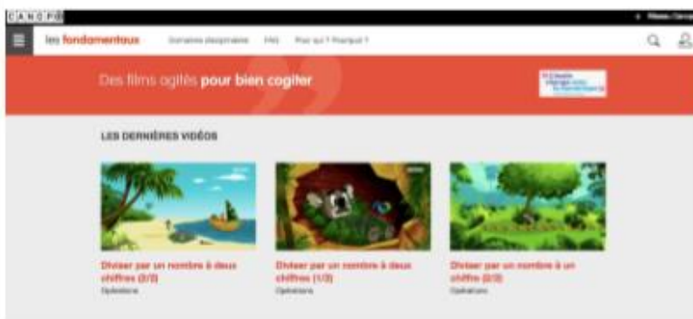
Une page internet

Internet permet à ses utilisateurs d'avoir accès à une multitude d'informations rapidement et souvent gratuitement. Pour trouver des informations, l'utilisateur peut se rendre sur un site internet ou utiliser un moteur de recherche qui lui offrira une liste de sites à consulter en lien avec sa recherche.